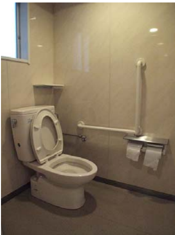
【左】 洋式トイレの ブース内