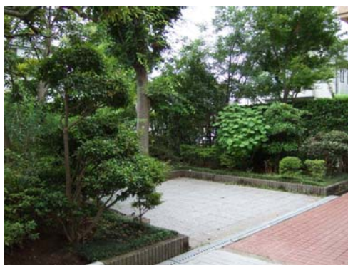
集会所周辺の通路の整備状況