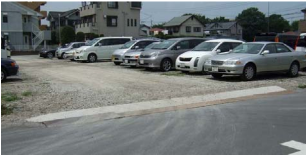
側溝上の通路部整備状況

店舗棟北側の外部駐車場（地主にお願いして式番街が優先使用）の通路部の凹凸の碎石補充と整備、壊れた車止めの交換、ロープ張替え、側溝の通路となる部分の改修、外灯 2 基の設備を行いました。碎石敷きのため、外部駐車場を利用される方は「急」のつく車の操作をしないでください。また、これまでの真暗な状態は改善されましたが、 車上荒らしなどに対しては万全ではないため、貴重品等は車内に置かないで下さい。