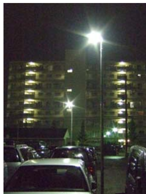
外部駐車場内の外灯