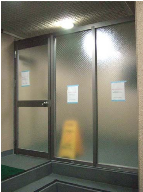
1号棟1階の防災備品スペース