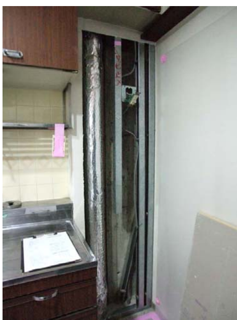
図1 キッチン流し台隣に開口

8月18日に準備工事にかかり、9月1日より住居内の工事を開始しました給排水設備改修工事、順調にすすんでいます。皆様のご協力に感謝いたします。そして引き続きのご協力をよろしくお願いいたします。