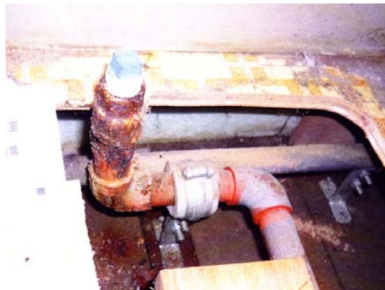
図4 洗面化粧台給水管の外面腐食の状況