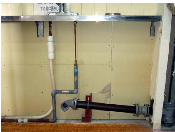
図5 キッチン流し台の給排水管工事

給排水設備改修工事の完了後、ユニットバスやキッチン流し台などの設備関係のリフォームを計画されている方もいらっしゃると思います。