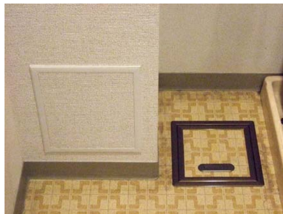
図3 洗面所に新設の点検口