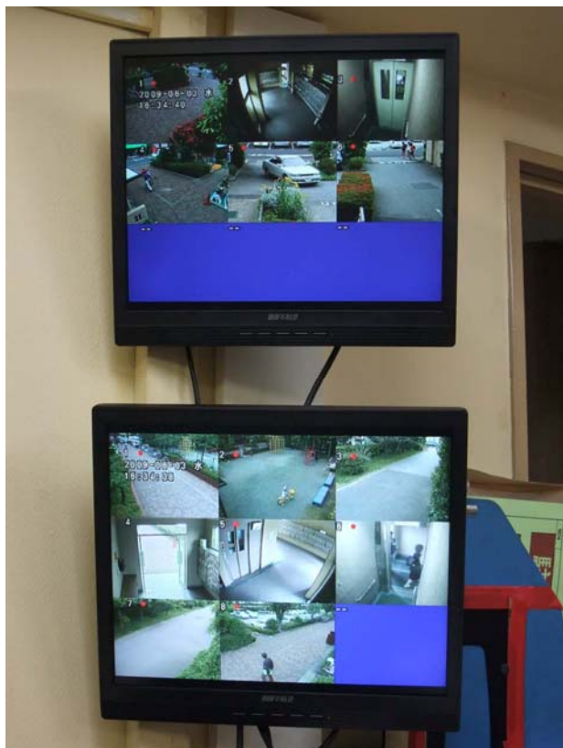
管理事務室内の防犯カメラ用モニターTV

『美しい式番街』(No.67)で紹介の防犯カメラの増設が管理組合総会で承認され、5月下旬に工事を完了しました。