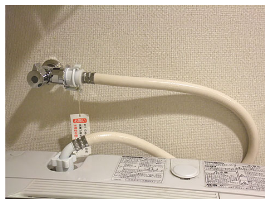
吐出口を横にした水栓 TW11(TOTO)

標準の洗濯機用水栓は壁面から突出し長が長く、全自動洗濯機を設置した場合、ホース等の収まりがよくありません。洗濯機用水栓を写真のように使うと改善されます。