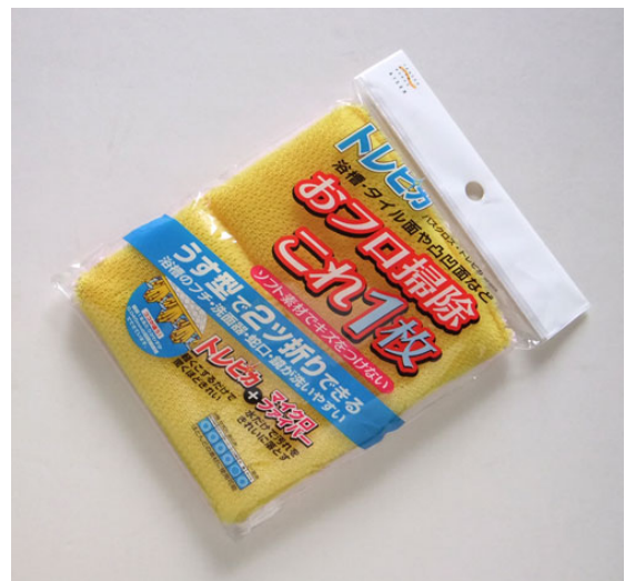
『バスクロス・トレピカ』(ビバホーム、298円)