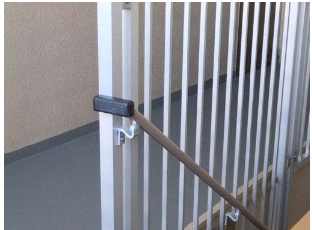
階段手摺の上側のカバー (イメージ図)