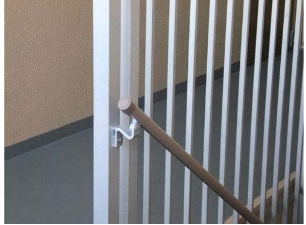
取り付けした手摺の上部 (現状)

つきましてはそれまでの間、 階段を降りる際に手摺の端部にショルダーバッグのショルダーストラップやコートのベルトなどを引っ掛けないようにご注意ください ますようお願いいたします。