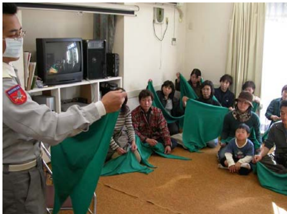
三角巾の使い方を勉強

12月5日早朝は大風が吹いていましたが、訓練時には穏やかとなり、南流山弐番街の防災訓練を実施することができました。