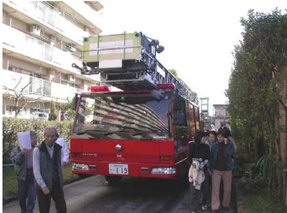
流山消防署のはしご車