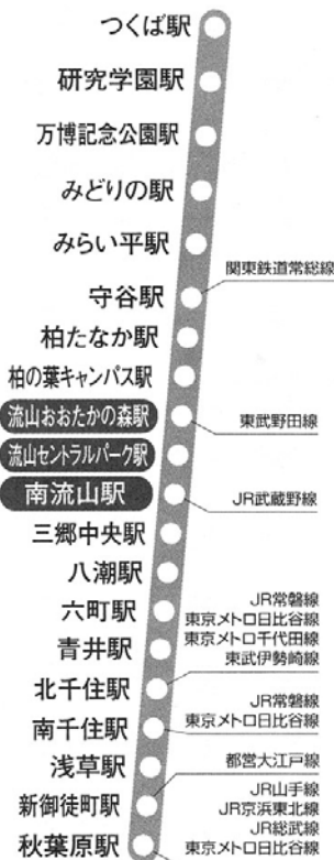
つくばエクスプレス路線案内

平成 17 年 2 月 9 日首都圏新都市鉄道(株)から沿線市町村に運賃等の説明があり、その後のニュースで開業日は今年 8 月 24 日と発表されました。「広報ながれやま」でもその内容が一部掲載されました。運行計画は 3 月末までに公表したいとのことですが、参考に南流山駅から主要駅までの運賃を紹介します。