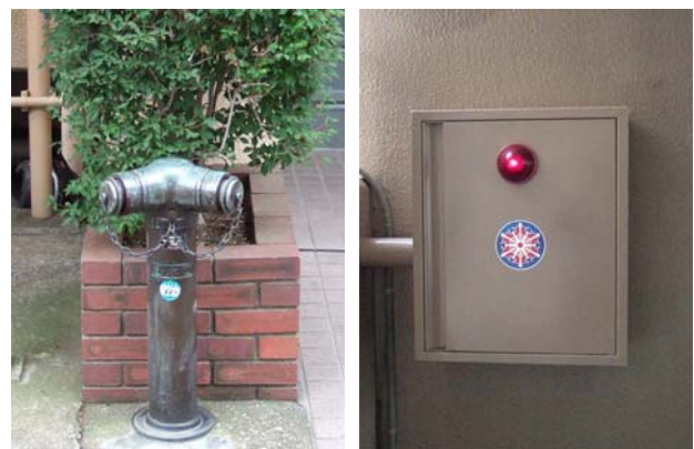
[送水口] [連結送水管箱]