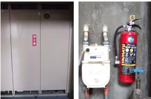
[メーターパネル] [ABC 消火器]

お住まいの玄関外のメーターパネルに「消火器」と表示されていますが、この中にABC消火器があります。この消火器は普通火災、油火災、電気火災に対応します。経年劣化があるため、管理組合で定期的に更新しています。