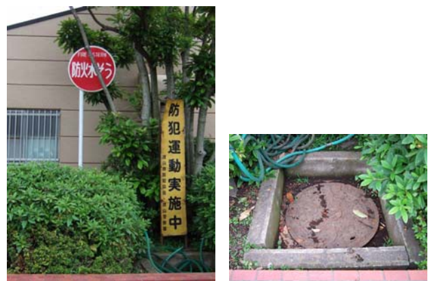
[防火水槽] [防火水槽マンホール]