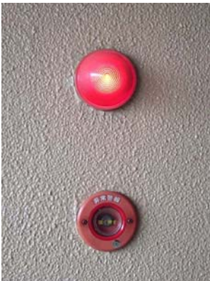
[非常警報押しボタン]

非常放送設備は非常ベルだけでは火災などの状況がわからず、混乱を招くおそれがあるため、使われます。スピーカはライオン公園、放送用アンプは管理人室に設備されています。