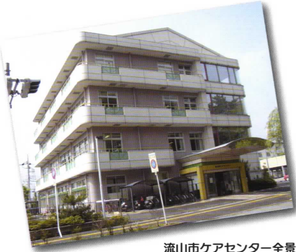
流山市ケアセンター全景