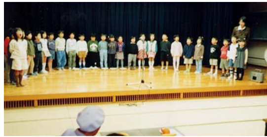
かぜのこ幼稚園 の子供たちの歌

南流山地区社協は流山市主催の南流山小学校区における敬老会を実行しています。これとは別に70才以上の方を対象に地域の方のご協力を受けて『ふれあい会食会』を開催しています。今年は3月5日開催されました。全ての出演者を紹介し切れませんが、かぜのこ幼稚園の元気な歌声、南流山小学校の皆さんの歌と演奏に聞き入り、南流中の皆さんの手話劇にはハンカチをあてておられる方もいらっしゃいました。また、中学校の皆さんにお話しいただいた「将来の夢」で皆、元気づけられました。