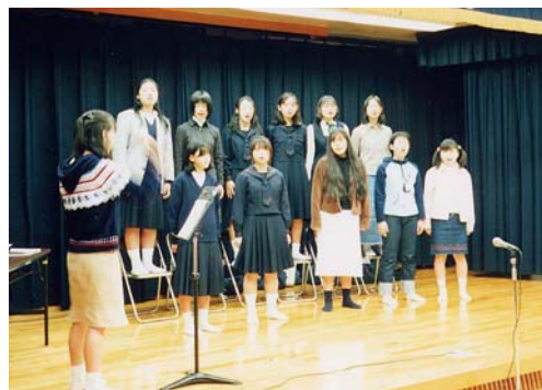
南流山中学校の皆さんによる手話劇