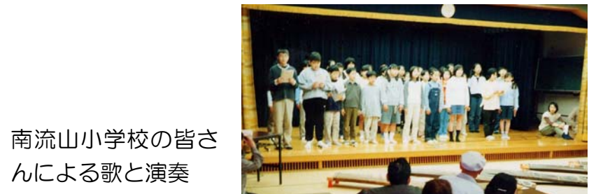
南流山小学校の皆さんによる歌と演奏