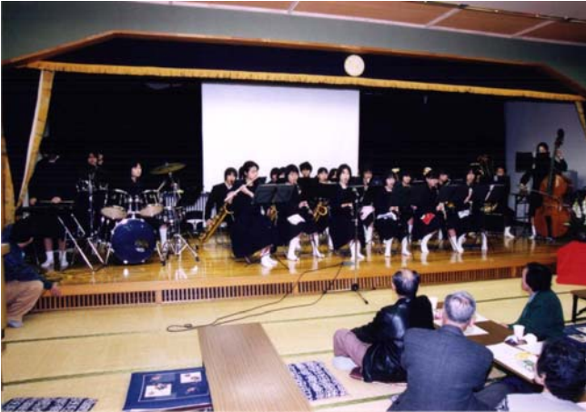
南流山中学校吹奏楽部の皆さんの演奏