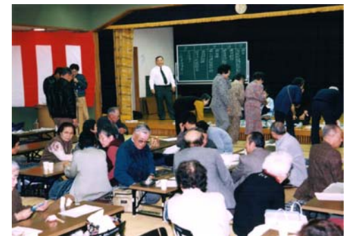
ビンゴを楽しむ皆さん