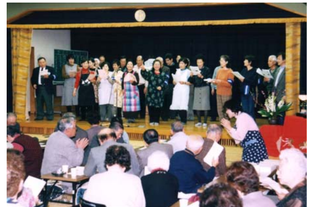
会の運営のメンバーによる合唱