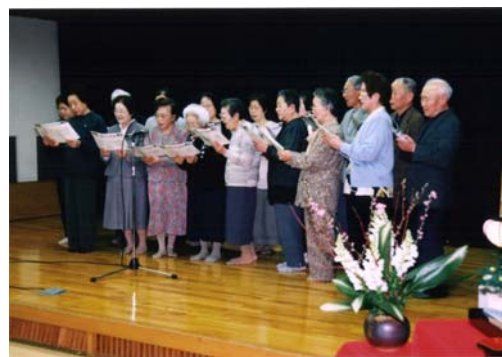
会食時間のコーラス