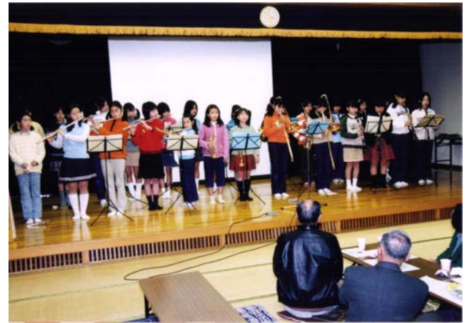
南流山小学校の合奏部の皆さんの演奏