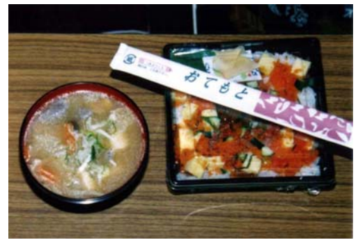
けんちん汁とちらし寿司