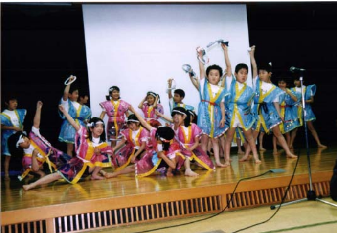
ちびっこ学童南クラブの皆さんの踊り