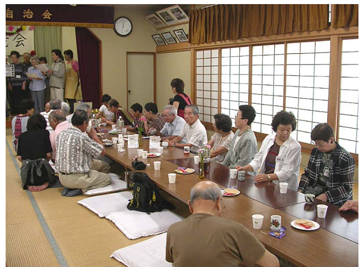
水仙の会にご参加の皆さん

ふれあいサロン「水仙の会」は南流山自治会館で毎月第 3 月曜日午前 10 時から午後 3 時まで地域のご高齢の方のために開催されています。体操、カラオケ、ゲーム等の楽しい内容で、会費 300 円で昼食も用意しています。たくさんの方が集まる楽しい会ですので、お気軽にご参加ください。