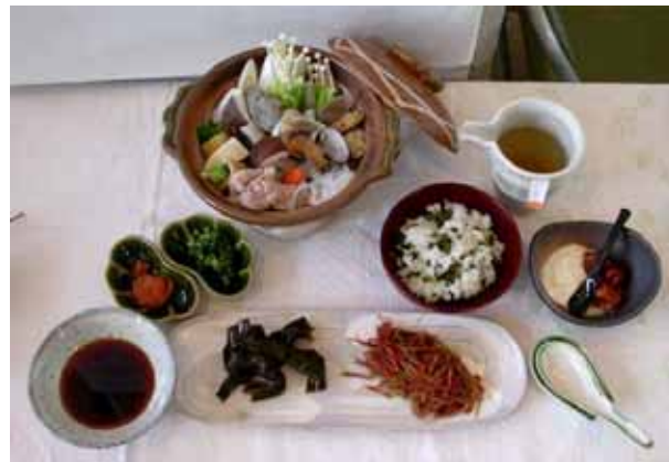
「健康を支えるシンポジウム」(1月30日)