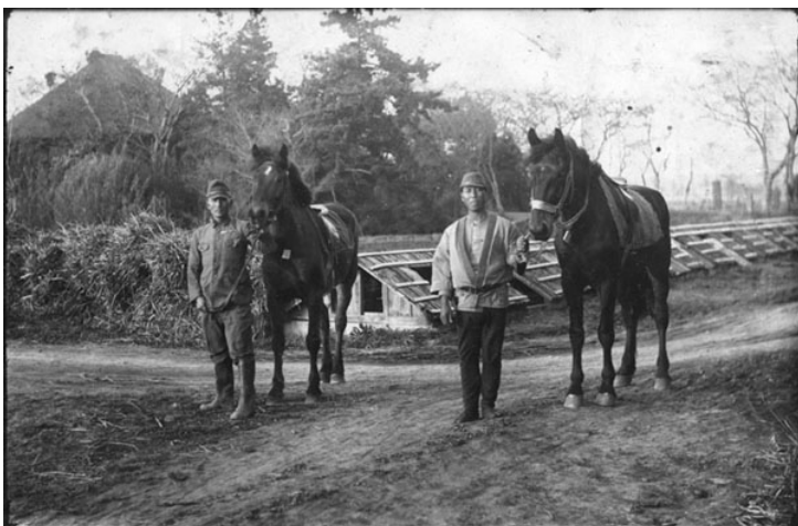
当時、珍しかった馬と一緒に(左後方は観音寺)(昭和 15 年頃)