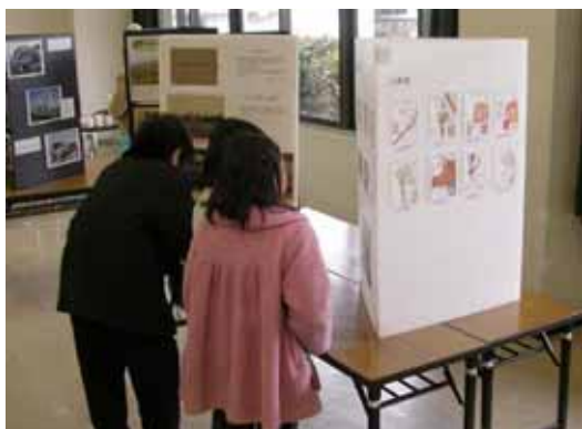
おともだちの絵を見る子供達

『第 2 回南流山展』を 3 月 5 日～6 日、南流山センターの講座室で開催し、約 200 名の方にご来場いただきました。今回は地域の以前の姿をよくご存知の木の方々に写真をお借りして、拡大したものを展示しました。そして地域の皆さんには昔の写真を囲んで昔話に花をさかせていただき、また、南流山に移り住んでこられた方からは「昔の日本はこうだった」と懐