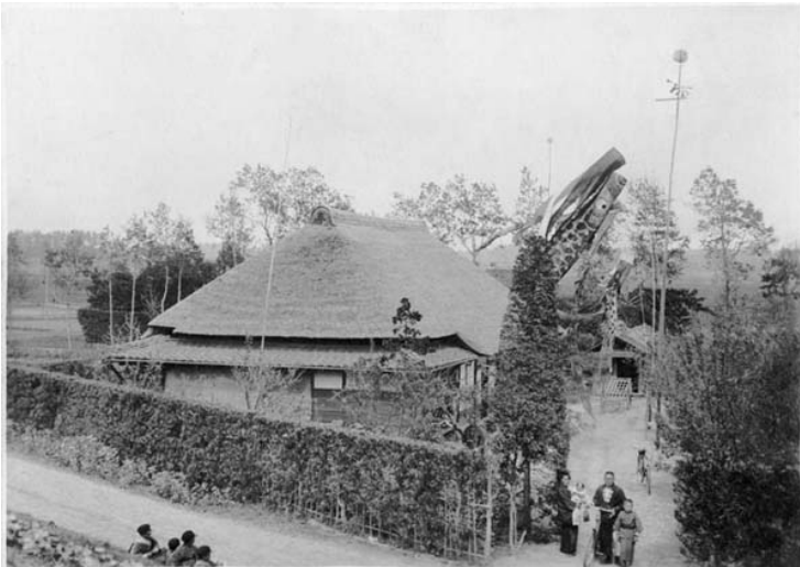
かやぶき屋根の家とこいのぼり (江戸川堤防の嵩上げにより現在は堤防の下に) 小林家のアルバムより(昭和 3 年頃)