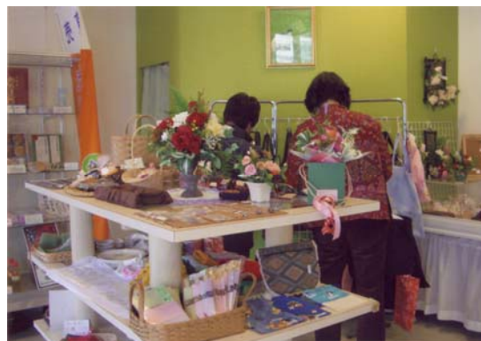
流山市の名産品が充実しています