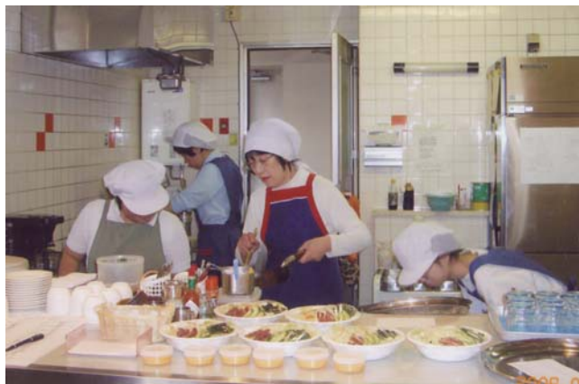
ランチ時は準備に皆さん、大忙しです

されながら働いている姿に、これからも体に気をつけて頑張りたいと思いました。市役所に用事で来られた折には是非、お立ち寄りください。