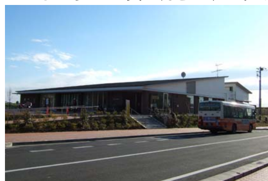
ほっとプラザ下花輪

「ほっとプラザ下花輪」の浴室の利用料金(流山市民)は大人200円、子供100円です。交通手段は南流山駅前の東武バス「クリーンセンター」行きが利用できます。また、駐車場も完備しています。お風呂とあわせて“ひばり”での買い物をお楽しみください。