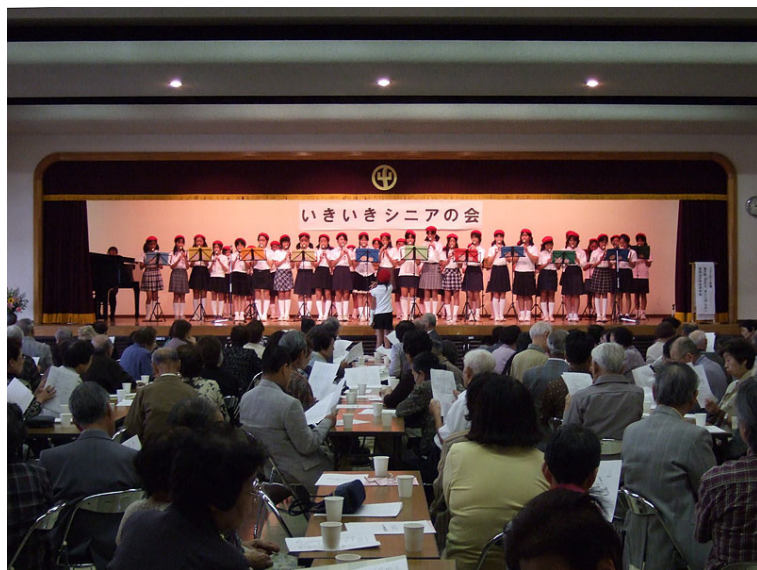
「いきいきシニアの会」(平成 20 年)の会場風景

また、南流山自治会は第 1、第 2、第 4 月曜日の午前 10 時から午後 4 時まで南流山自治会館の開放日とし、地域の皆さんにお気軽にお立ち寄りいただけるようにしています。こちらもご利用ください。