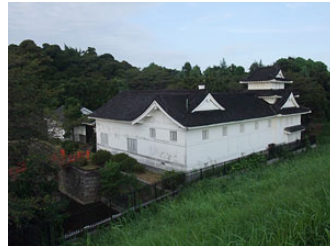
御用蔵（キッコーマン）

葛飾橋を越えて松戸側の堤防上の道路で市川橋までのサイクリングも楽しめます。途中に矢切の渡し、柳原水閘（土木学会選奨土木遺産）、里見公園があり、小岩菖蒲園は市川橋を渡った対岸となります。