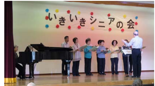
わらべの会のコーラス