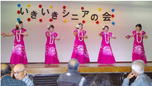
カ・レイ・アロハ南流山のハワイアンダンス