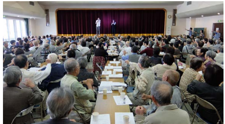
南部地域包括支援センターの健康の話・体操