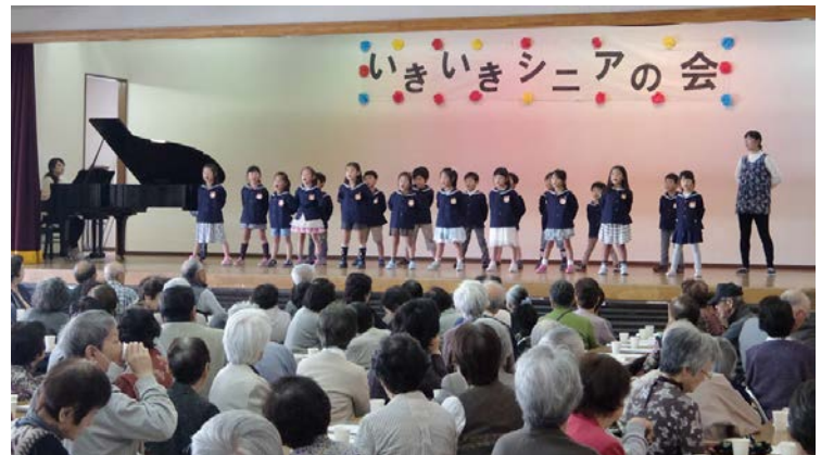
南流山聖華保育園の歌(「山の音楽家」など)