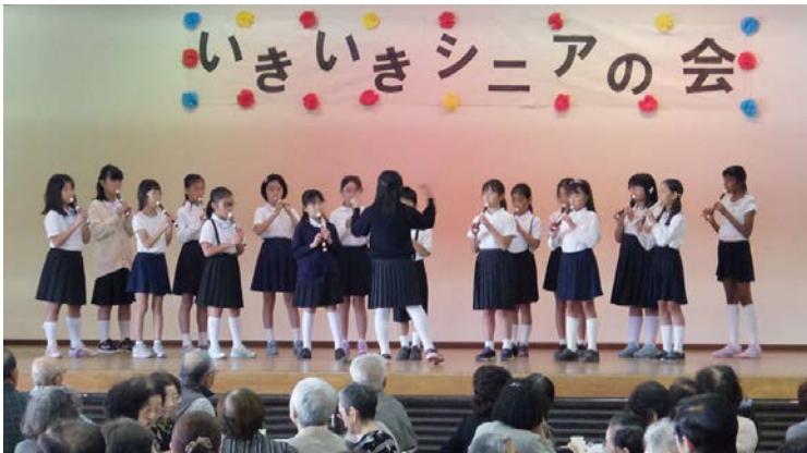
南流山小学校の音楽部4年生の演奏(「カントリーロード」等)