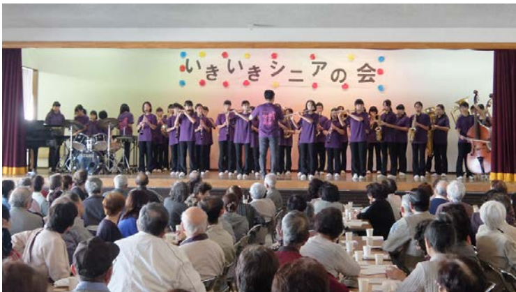
南流山中学校吹奏楽部の演奏(「ディズニーメドレー」等)

会の運営にご協力いただいた自治会、ボランティア組織などの皆様、4名の中学生ボランティア、4名の小学生ボランティアの皆様に感謝します。