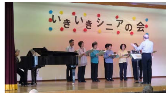
わらべの会のコーラス