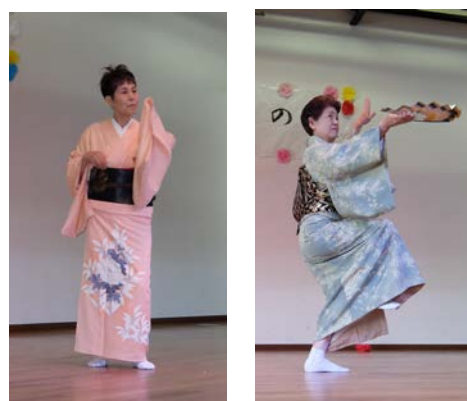
南流山寿楽会の皆さんの舞踊