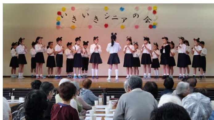
南流山小学校の音楽部4年生の演奏(「上を向いて歩こう」等)