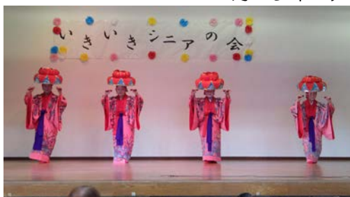
流山琉舞の会の皆さんの琉球舞踊