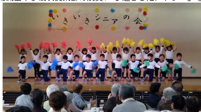
南流山幼稚園の踊り(「運動会で踊ったおどり(YMCA)」)