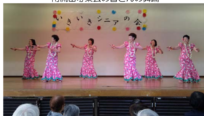
カ・レイ・アロハ南流山のハワイアンダンス