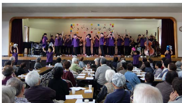
南流山中学校吹奏楽部の演奏(「手遊びうたメドレー」等)

会の運営にご協力いただいた自治会、ボランティア組織などの皆さん、10名の中学生ボランティア、3名の小学生ボランティアの皆さんに感謝します。