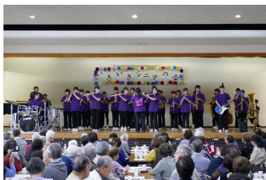
南流山中学校吹奏楽部の演奏