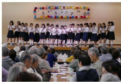
南流山小学校の音楽部の演奏