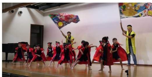
南流山保育園ひびき