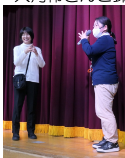
南部地域包括支援センターによる「健康のお話」