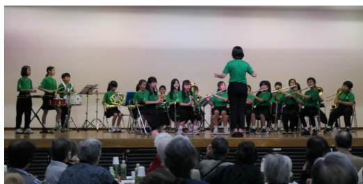
南流山第二小学校音楽部