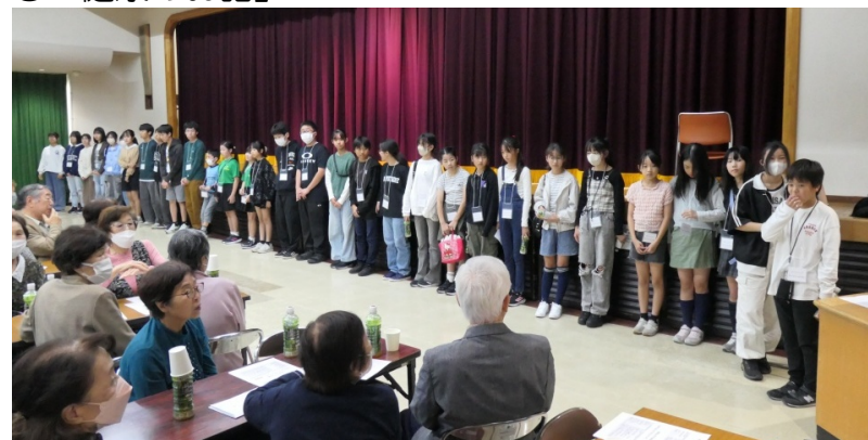
小学生と中学生のボランティアの皆さん