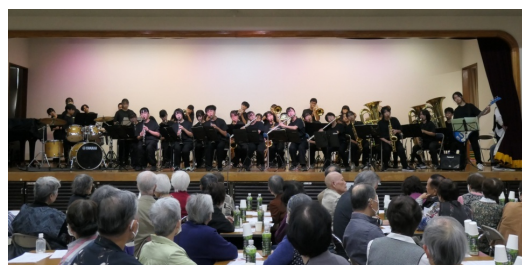
南流山中学校吹奏楽部

訪問・見守りの活動を行う「南流山ひまわり会」の利用案内、「いきいきシニアの会」併設の南部地域包括支援センターの出張相談所の利用案内は70～75歳未満の754名の皆様にもお届けしました。