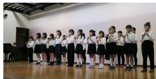
南流山小学校音楽部