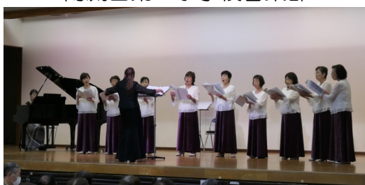
女性合唱団「エーデルワイス・コア」